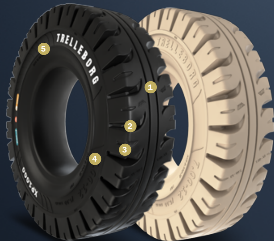
Diseño del dibujo patentado