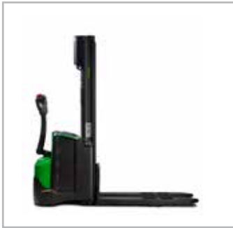
CESAB S210-214, S208L-214L, S220D