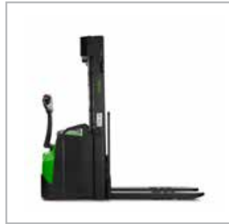
CESAB S215-220, S215L-220L